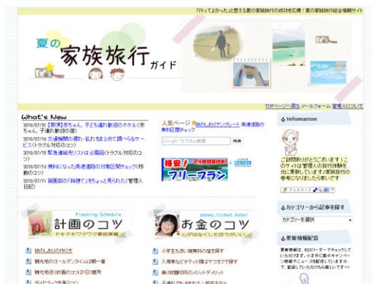
夏の家族旅行ガイド