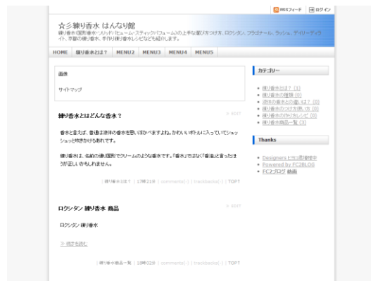
☆彡練り香水 はんなり館