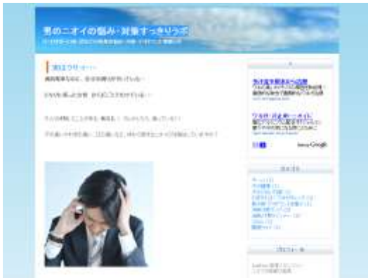
男のニオイの悩み・対策すっきりラボ http://201care.blog134.fc2.com/