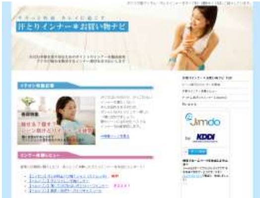
汗とリナー*お買い物ナビ http://sweat.jimdo.com/