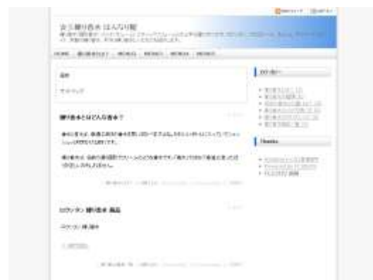
☆彡練り香水 はんなり館