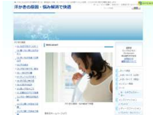
汗かきの原因・悩み解消で快適 http://asekkaki.net/