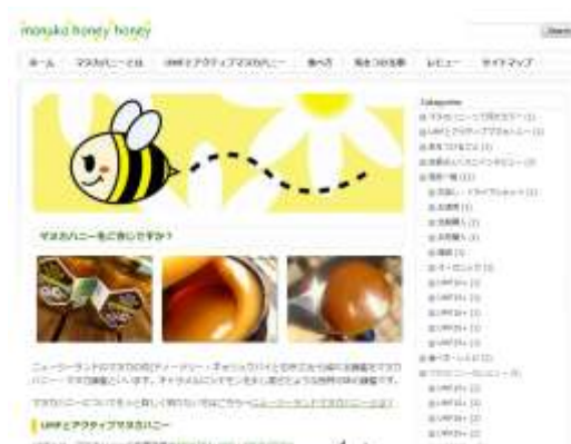
ニュージーランドマヌカハニーを食べよう