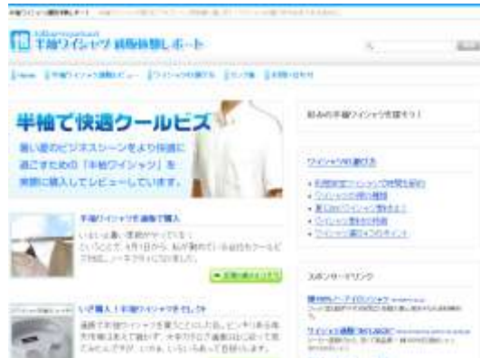
半袖ワイシャツ通販体験レポート http://y-shirts.taiken-report.net/