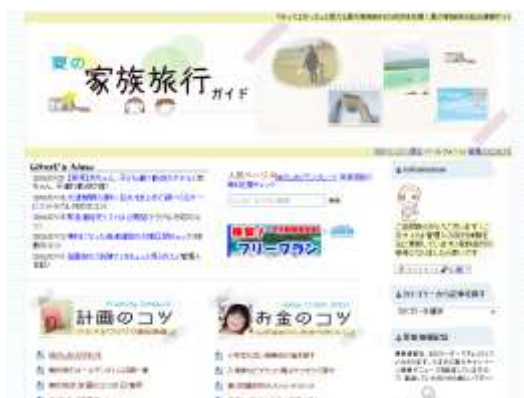
夏の家族旅行ガイド