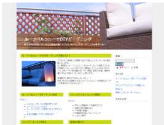
ルーバルコニーでDIYガーデニング