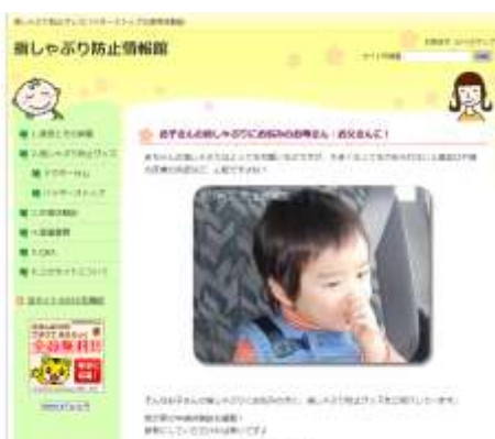
指しゃぶり防止情報館