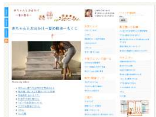
赤ちゃんとお出かけ～夏の散歩～