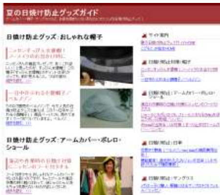
夏の日焼け防止グッズガイド