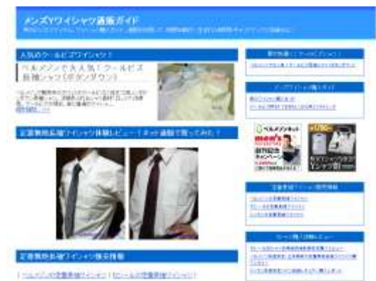
メンズYワイシャツ通販ガイド http://yshirt.bizshelf.jp/