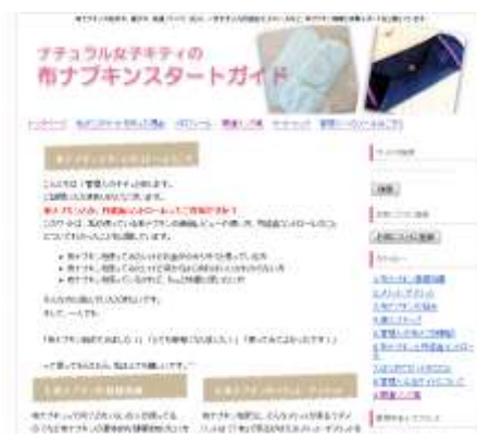
ナチュラル女子キティの布ナプキンスタートガイド